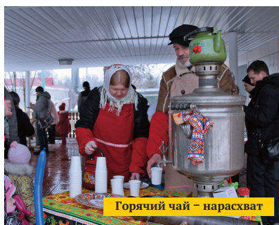
Горячий чай – нарасхват

Позитивные эмоции и весеннее настроение заводчанам были обеспечены.