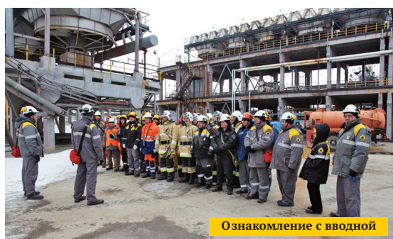
Ознакомление с вводной

Кстати, подобные учения в этот день прошли во всех дочерних предприятиях компании «Роснефть».