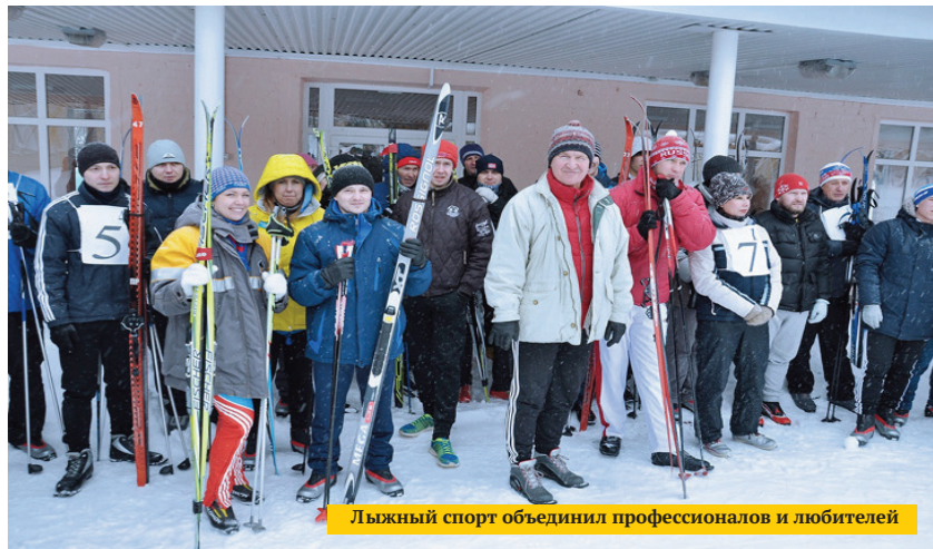
Лыжный спорт объединил профессионалов и любителей

18 февраля на базе ДОЛ им. Ю.А. Гагарина прошли соревнования по лыжным гонкам в зачёт спартакиады среди заводских и сервисных служб АО «НК НПЗ», организуемой ОППО АО «НК НПЗ» Нефтегазстройпрофсоюза России.