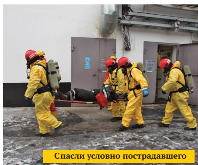
Спасли условно пострадавшего