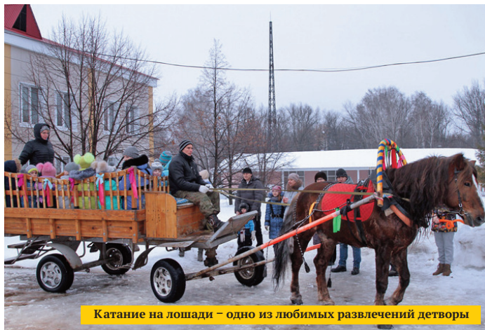
Катание на лошади – одно из любимых развлечений детворы