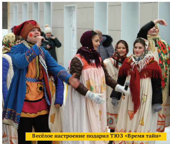
Весёлое настроение подарил ТЮЗ «Время тайн»